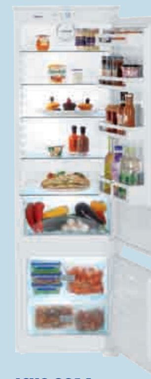
ICUS 3214 Comfort