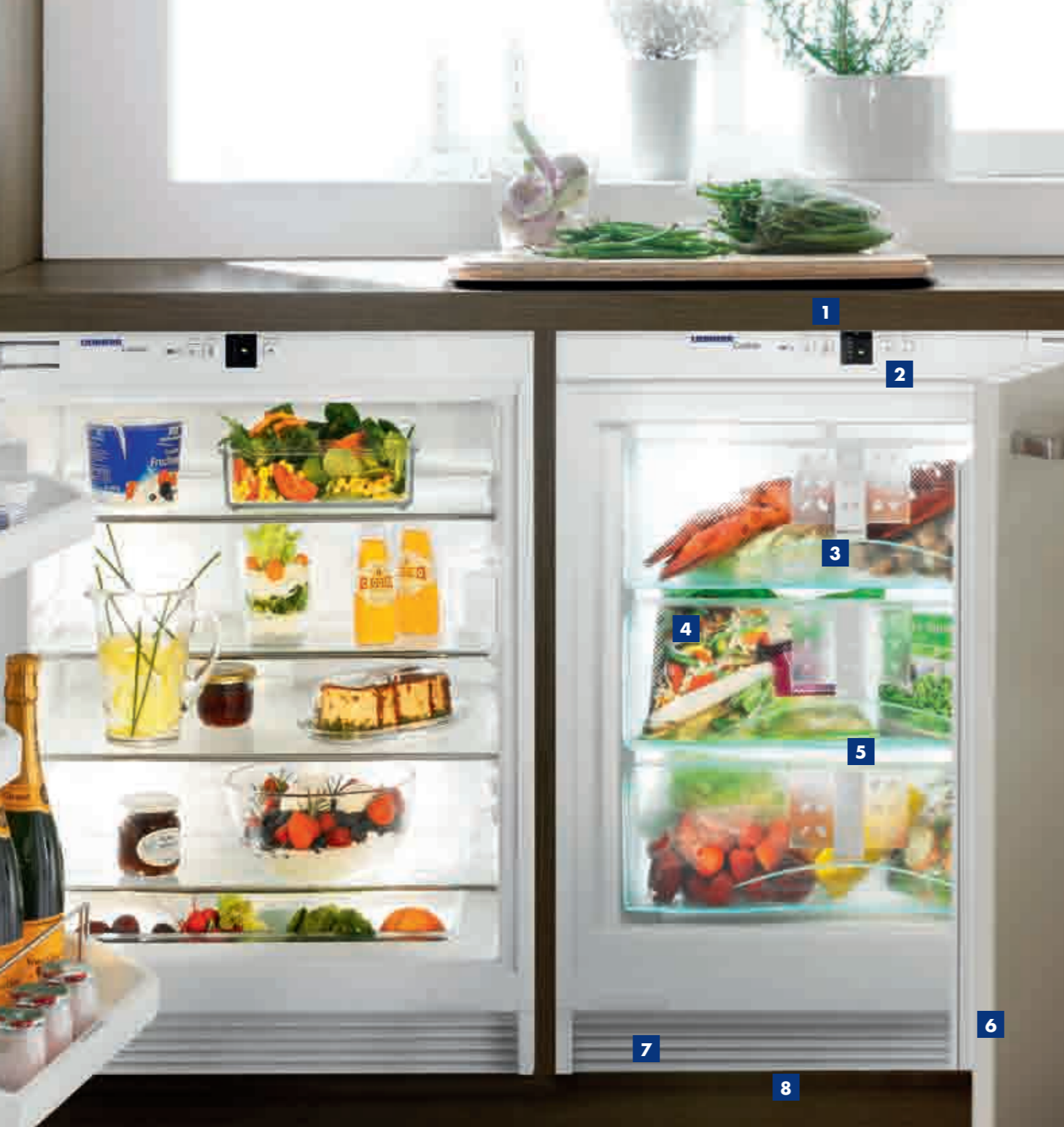
UIK 1620 / UIG 1323 Side-by-Side Das Gefriergerät muss rechts stehen.