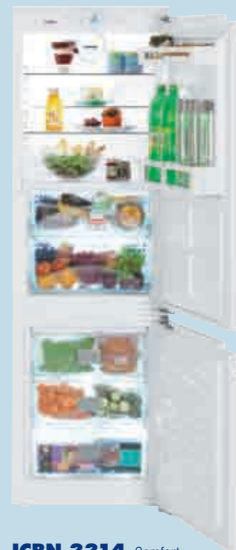
ICBN 3314 Comfort