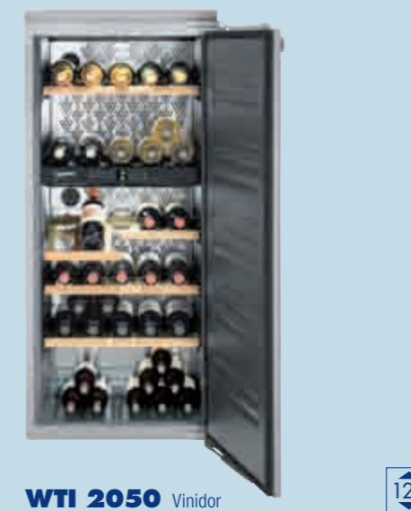
WTI 2050 Vinidor