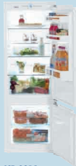
ICP 2914 Comfort