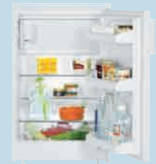
UK 1414 Comfort