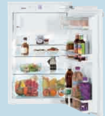
IK 1654 Premium