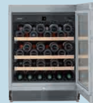
UWKes 1752 GrandCru