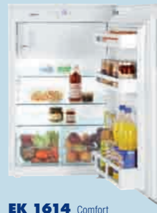
EK 1614 Comfort