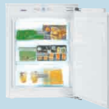
IG 1014 Comfort