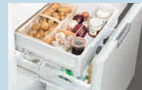
Das Kellerfach als Speisekammer-Ersatz ist ideal für kälteempfindliche Lebensmittel wie Kartoffeln und Zwiebeln

11 SoftTelescopic. Komfortabler Selbsteinzug mit sanfter Schließdämpfung des Kellerfachs