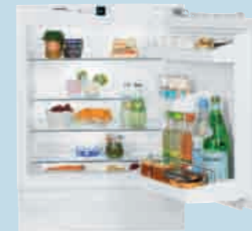
UIK 1620 Comfort