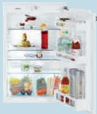
IK 1610 Comfort