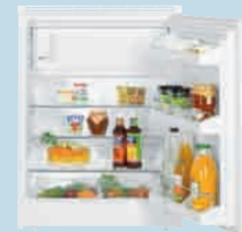
UK 1524 Comfort