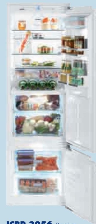
ICBP 3256 Premium