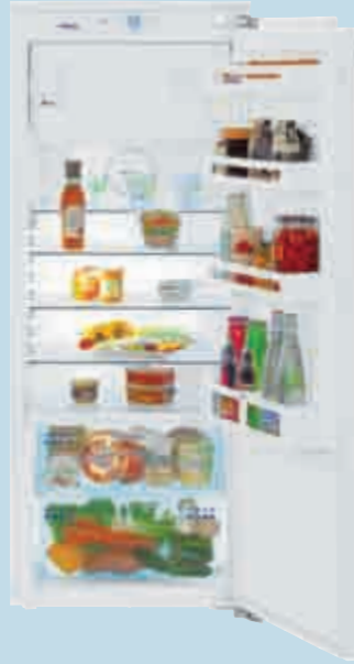
IKB 2714 Comfort