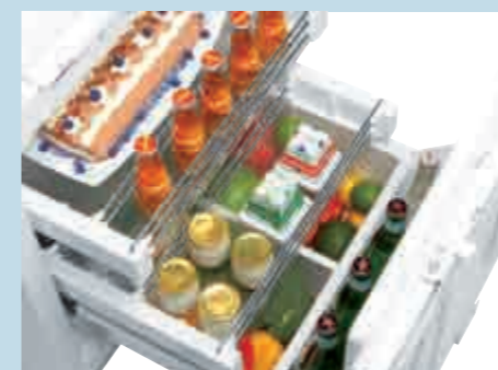
Auszugswagen mit Vollauszug