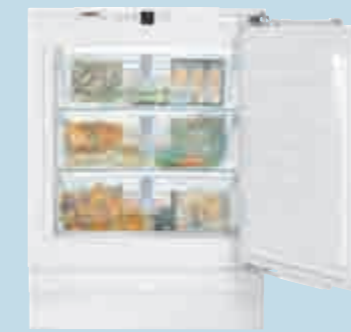
UIG 1323 Comfort