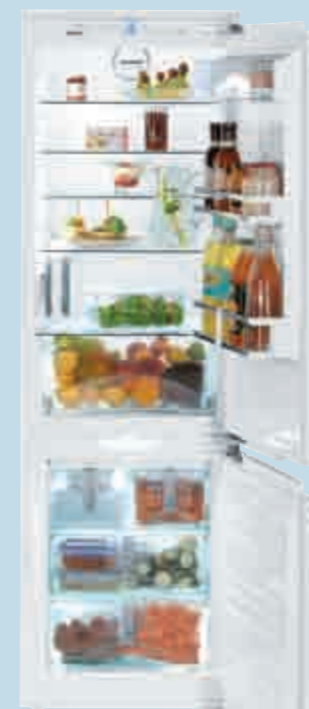
ICN 3366 Premium