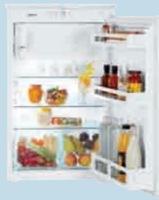
IKS 1614 Comfort