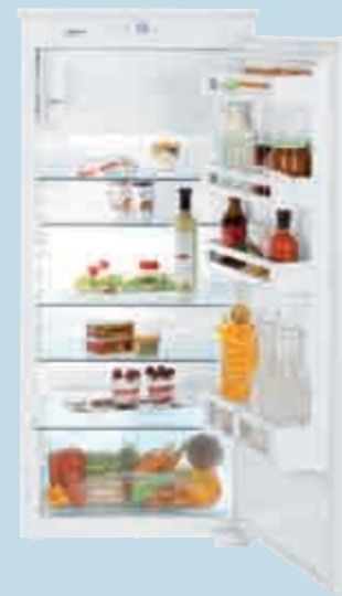
IKS 2314 Comfort