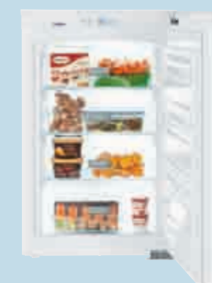
EG 1614 Comfort