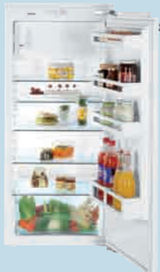
IK 2314 Comfort