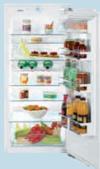
IK 2350 Premium