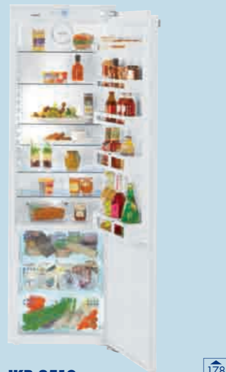
IKB 3510 Comfort