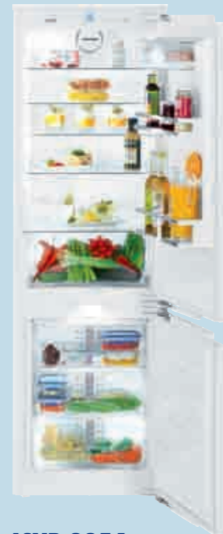
ICNP 3356 Premium