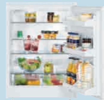
UK 1720 Comfort

7 Stellfüsse vorne. Höhenverstellbar für optimale Aufstellung