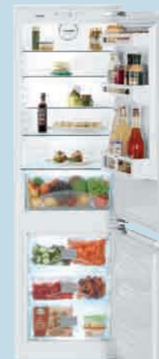
ICUN 3314 Comfort