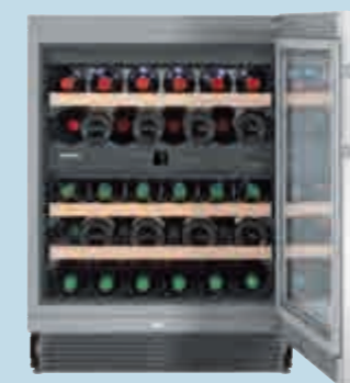
UWTeS 1672 Vinidor