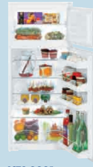
ICTS 2221 Comfort