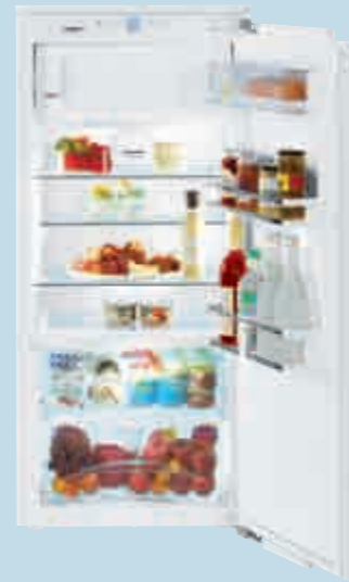
IKB 2354 Premium

GUT (2,0) Stiftung Warentest IKBP 2354 Ausgabe 7/2013 www.test.de 13FA30