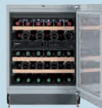
UWT 1682 Vinidor