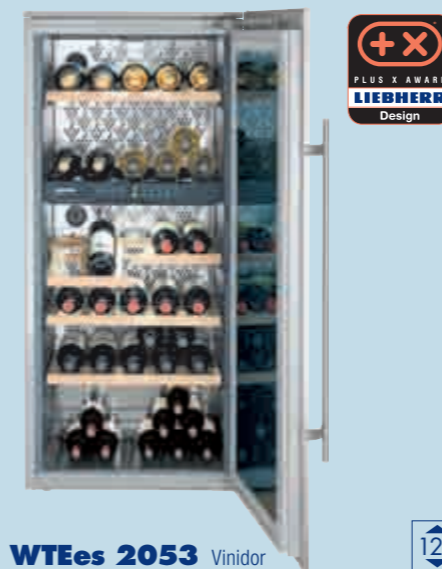
WTEs 2053 Vinidor