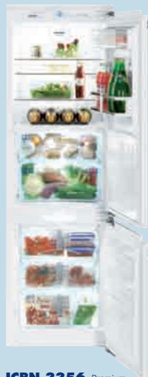
ICBN 3356 Premium