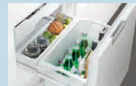
Bei separat regelbarer Temperatur von +4 bis +14°C können auch Getränke, Konfitüre, Senf und Co. bestens gelagert werden