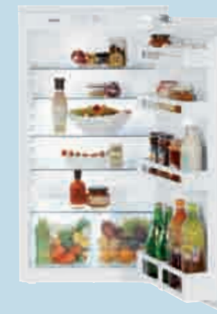
IK 1910 Comfort