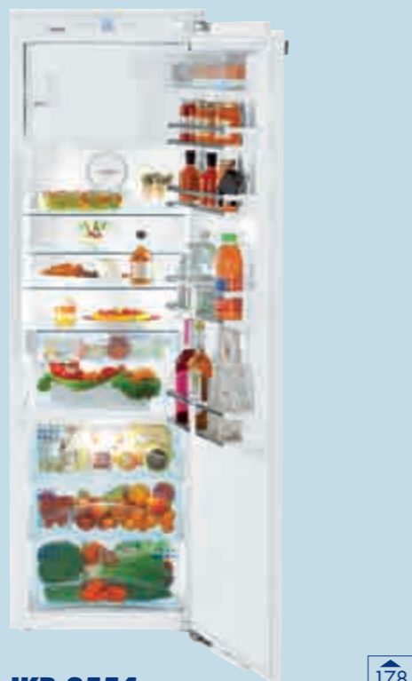
IKB 3554 Premium