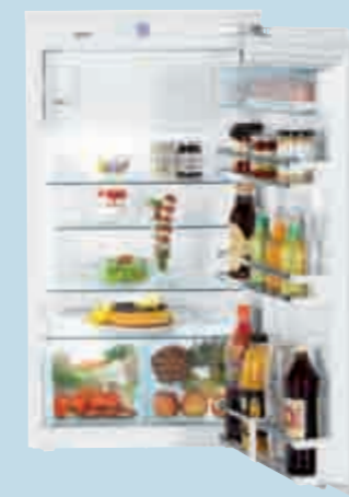
IK 1954 Premium