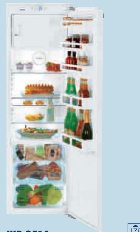
IKB 3514 Comfort