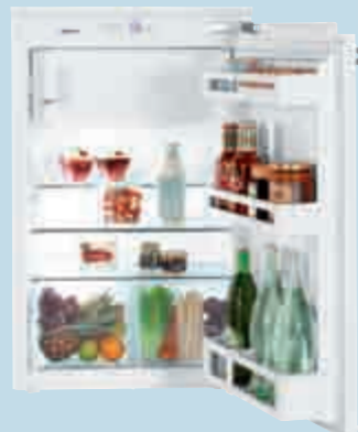
IK 1614 Comfort