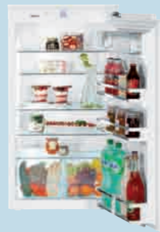
IK 1950 Premium