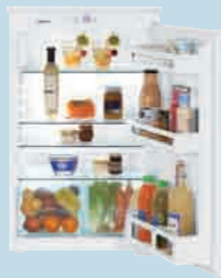
IKS 1610 Comfort