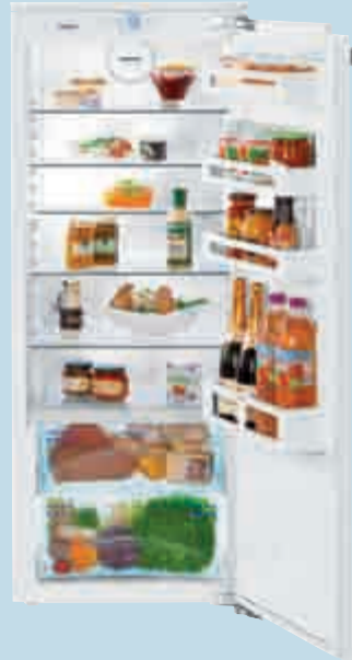
IKB 2710 Comfort