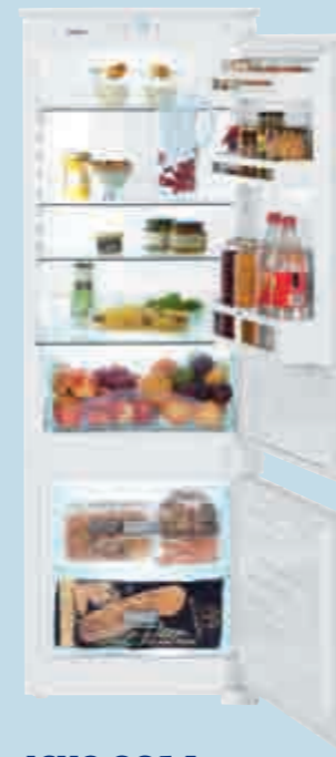
ICUS 2914 Comfort