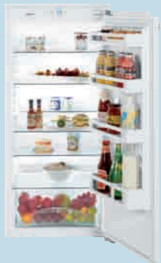
IK 2310 Comfort