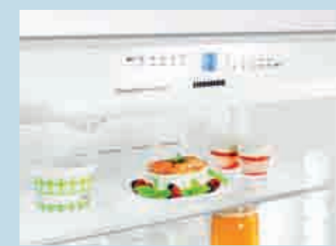
PremiumPlus-Elektronik mit Touch-Steuerung