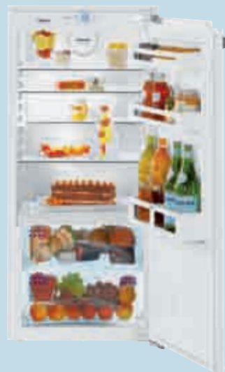
IKB 2310 Comfort