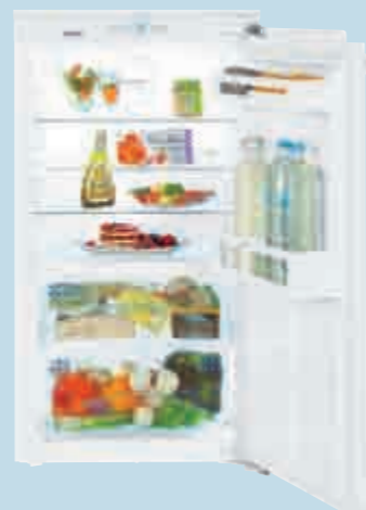
IKB 1910 Comfort