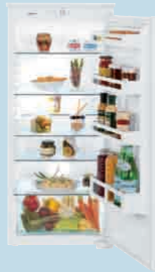
IKS 2310 Comfort