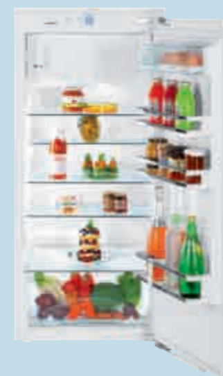
IKP 2354 Premium