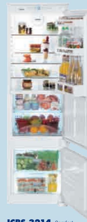
ICBS 3214 Comfort