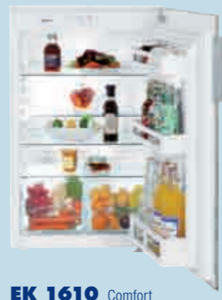
EK 1610 Comfort