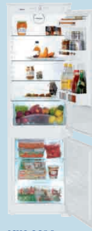
ICUS 3314 Comfort