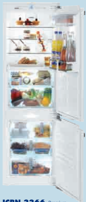
ICBN 3366 Premium