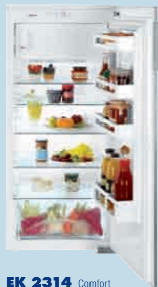
EK 2314 Comfort