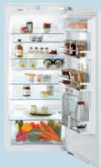
IKP 2350 Premium