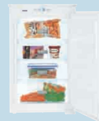
IGS 1614 Comfort