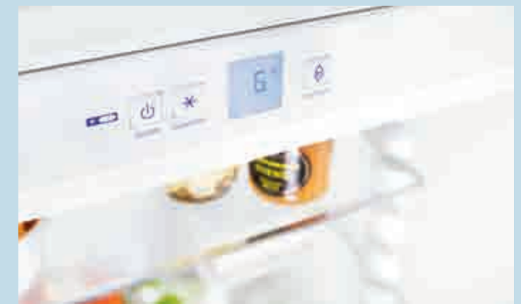
Comfort-Elektronik mit Tastensteuerung