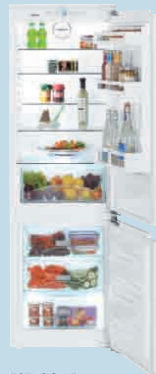
ICP 3314 Comfort