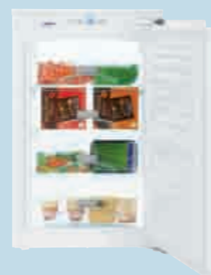
IG 1614 Comfort