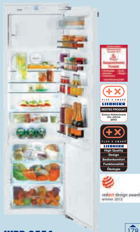
IKBP 3554 Premium