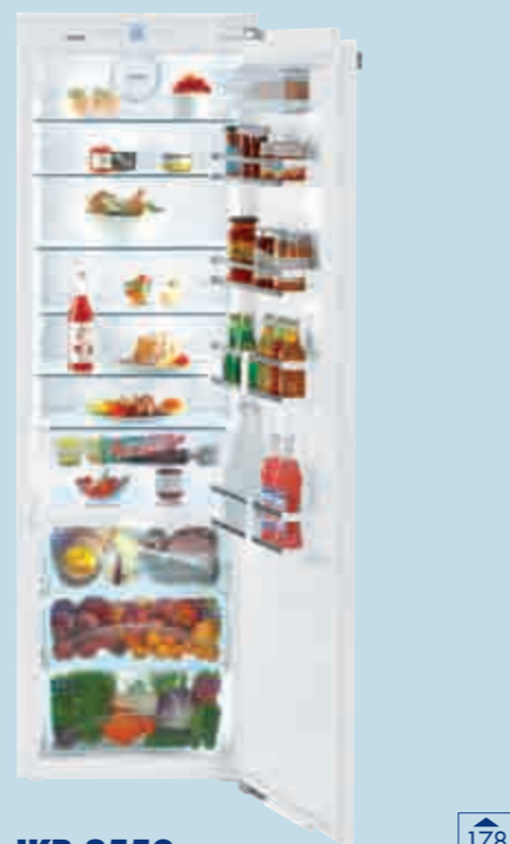
IKB 3550 Premium