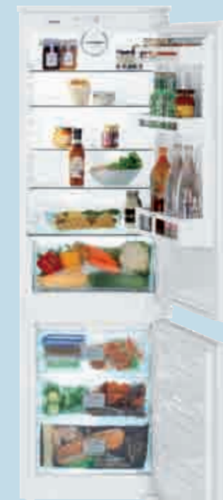
ICUNS 3314 Comfort