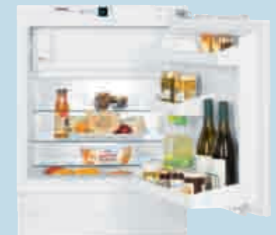
UIK 1424 Comfort