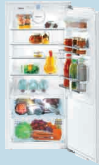
IKB 2350 Premium