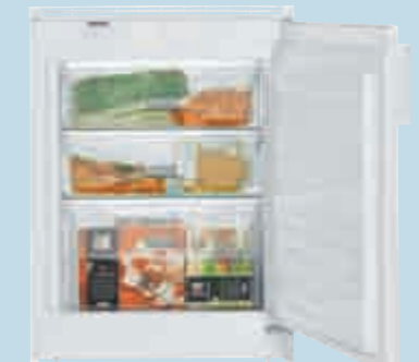
UG 1211 Comfort

Sonderzubehör (siehe Seite 94-95) · 04, 05