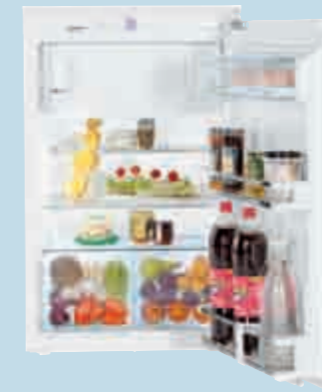
IKP 1654 Premium