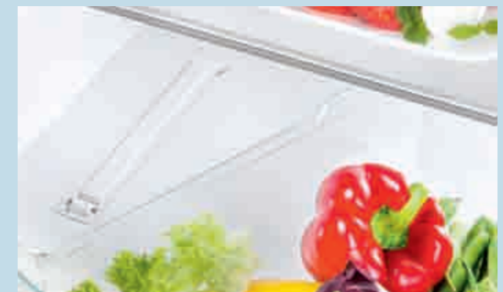
Großes Obst- und Gemüsefach auf Rollen bei Modellen 122er Nische