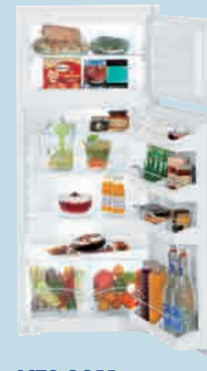
ICTS 2211 Comfort