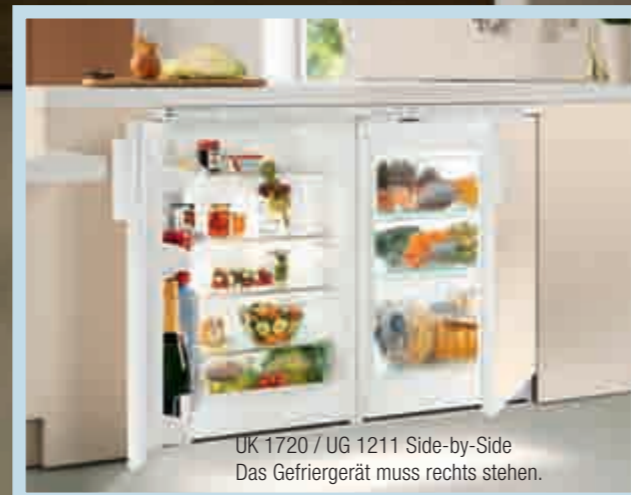
UK 1720 / UG 1211 Side-by-Side Das Gefriergerät muss rechts stehen.