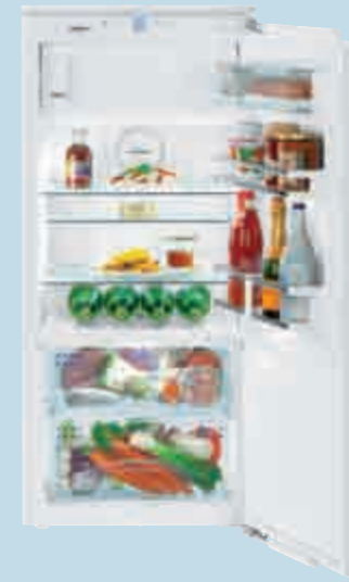
IKBP 2354 Premium