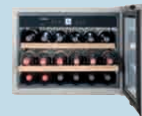
WKES 553 GrandCru