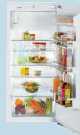
IK 2354 Premium