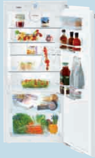
IKBP 2350 Premium