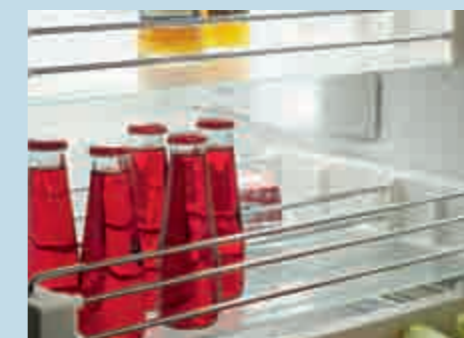
Glasplatten mit Vollauszug