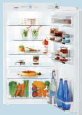
IKP 1950 Premium