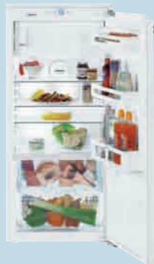
IKB 2314 Comfort