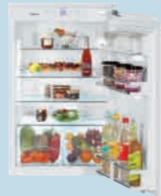
IK 1650 Premium