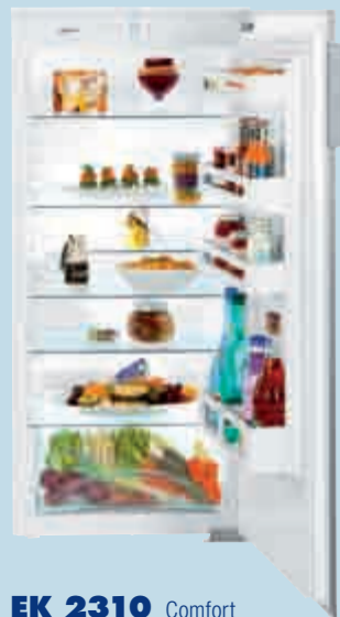
EK 2310 Comfort