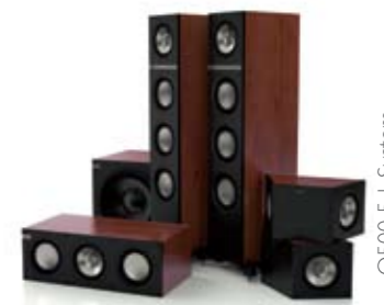
Q500 5.1 System.