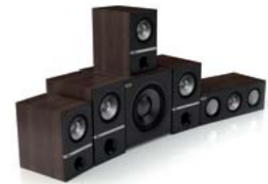
Q300 5.1 System.