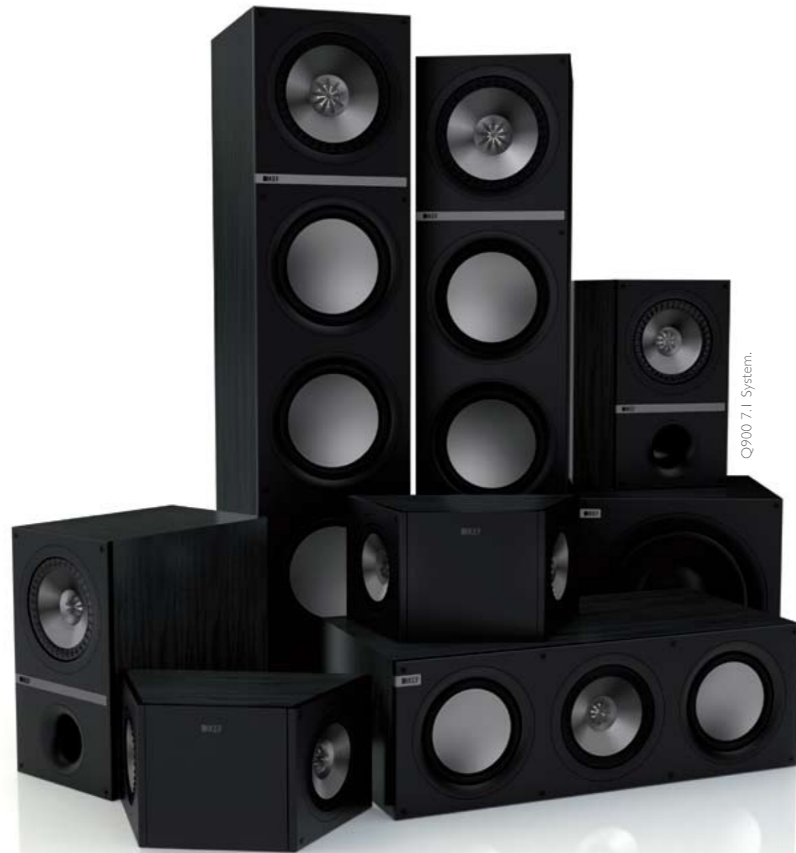
Q900 7.1 System.