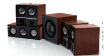
Q100 5.1 System.