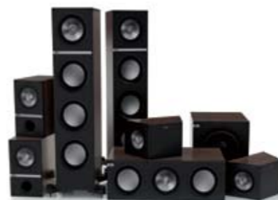
Q700 7.1 System.