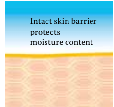
Intact protective skin barrier with lipids rich in linoleic acids.

Visit us at www.linola.de and select the drop-down menu "country". Here you will find all the latest information on Linola Lotion , Linola Face , Linola Hand and Linola Foot Lotion as well as other Linola products for a wide range of skin problems.