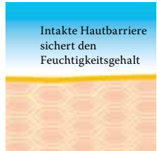
Intakte, schützende Hautbarriere mit Linolsäure-reichen Lipiden.

Besuchen Sie uns unter www.linola.de . Denn dort haben wir für Sie alle aktuellen Informationen über Linola Hautmilch , Linola Gesicht , Linola Hand und Linola Fuß-Milch sowie zu weiteren Linola-Produkten bei verschiedenen Hautproblemen bereitgestellt.