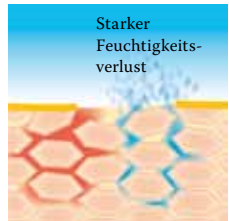
Lipidverlust führt zu einer gestörten Hautbarriere: Die Haut verliert viel Wasser und trocknet aus.